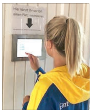
Die Tennisabteilung des BTSV Eintracht Braunschweig hat mit den Fördermitteln der Braunschweigischen Sparkassenstiftung die herkömmliche Magnettafel gegen ein Online-Reservierungstool ausgetauscht, das weitere benutzerfreundliche Module anbietet, die Interaktivität und Austausch fördern.

Mit den Fördermitteln konnte die Anschaffung von notwendiger Hard- und Software realisiert werden. So wurde zum Beispiel Noten-Books angeschafft, die das mobile