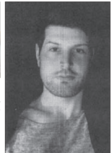
Die Polizei Wolfenbüttel fragt: