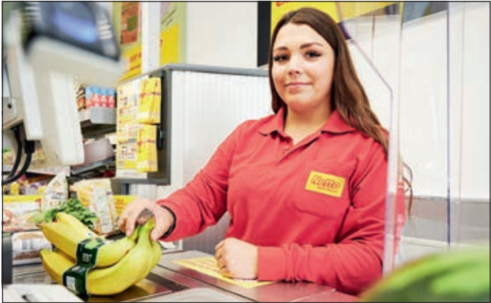
Für einen gelungenen Ausbildungsbeginn erhalten die Nachwuchskräfte bei Netto ein Ausbildungs-Starter-Paket.

In die Ausbildung, fertig, los! Der Startschuss für das Ausbildungsjahr 2020 ist gefallen und Netto Marken-Discount begrüßt bundesweit über 2.000 neue Auszubildende zu ihrem Karriereweg. Im August starten die Nachwuchskräfte in ihre Ausbildung. Interessante Unternehmensblicke und alle wichtigen Informationen rund um das neue Arbeitsumfeld gibt Netto den Jungtalenten am ersten Arbeitstag mit auf den Weg: Die Youngsters lernen ihr Unternehmen und den Discounter mit der größten Lebensmittelauswahl im Detail kennen.